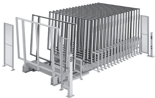
給システム ミストレロ社製の半自動コンパクトラックシステム(上)

同社設備は「コンパクト」「省コスト」「カスタマイズ」「安全性」がコンセプト。板ガラス業界では少量多品種化が進んでおり、ガラス加工工場で在庫する素板の品種が増大している。従来のAラック、4面回転台では在庫可能な品種数に限界があり、多様な品種を在庫するには広いスペースが必要になる。こうしたことから、限られたスペースに多くの品種をコンパクトかつ安全に在庫し、工場のスペースを有効活用できるラックシステムのニーズが急増している。